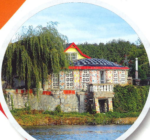
BRZEG JEZIORA ŻEŃSKO

SZLAK TRZECH JEZIOR (zespół przyrodniczo-krajobrazowy), to bardzo piękny kompleks wodny, składający się z trzech polodowcowych jezior: Klukom, Żeńsko, Raduń, połączonych jeszcze bardziej urokliwymi kanałami. Ten szlak, o łącznej długości ponad 10 km i powierzchni ponad 220 ha, jest obszarem bogatego występowania flory i fauny.