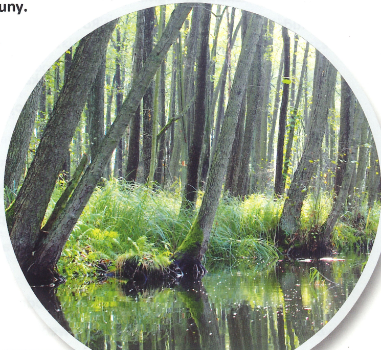
KANAŁ ŁĄCZĄCY JEZIORO ŻEŃSKO I JEZIORO RADUŃ