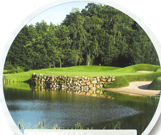
POLE GOLFOWE MODRY LAS