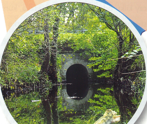
POCZĄTEK KANAŁU ŁĄCZĄCEGO JEZIORO ŻEŃSKO I JEZIORO RADUŃ