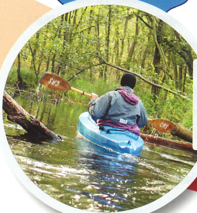
KANAŁ ŁĄCZĄCY JEZIORO ŻEŃSKO I JEZIORO RADUŃ

Urząd Miejski w Choszcznie ul. Wolności 24, 73-200 Choszczno www.choszczno.pl www.AtrakcyjneChoszczno.pl