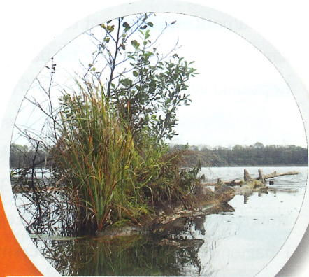
BRZEG JEZIORA RADUŃ