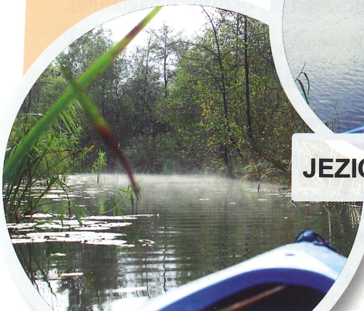
KANAŁ ŁĄCZĄCY JEZIORO KLUKOM I JEZIORO ŻEŃSKO