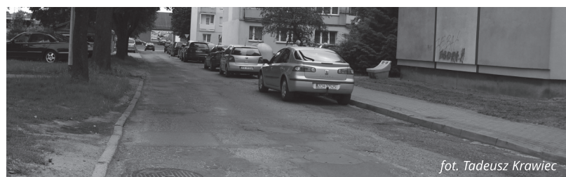
fol. Tadeusz Krawiec