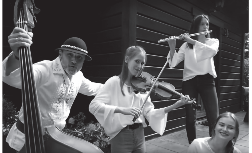
fot. mala_kapela_groniczek_2021_01_03 - fot. prtscr. YT