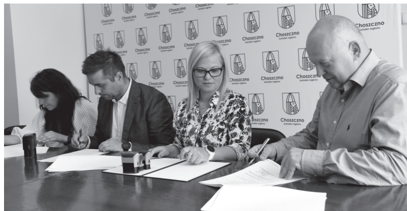
fol. Katarzyna Kubacka

terenie dzisiejszego „placu przy fontannie”, obecnie otoczonego ulicami Domu Towarowego Sezam, a także ul. Bolesława Chrobrego, Wolności i Rynek, znajdowały się budynki mieszkalne i prywatne firmy, w tym m.in. duża rozlewnia wód (zachowało się zdjęcie lotnicze z 1938 roku). Pierwsze poważniejsze odgruzowania tego terenu, przeprowadzono dopiero kilkanaście lat po wojnie. Potem, przez kolejnych kilkadziesiąt lat, teren ten uważany był za wizytówkę miasta, a także miejsce spotkań czy organizowanych przeróżnych imprez. Podobną rolę ma pełnić po przebudowie. – Właśnie dlatego postanowiliśmy najpierw stworzyć koncepcję zagospodarowania wraz z dwiema wizualizacjami w formacie 3D. Poddamy je ocenie i dopiero potem wykonamy następny krok, czyli skompletujemy dokumentację na przebudowę tego terenu – podsumował wódcarz miasta. Dodajmy, że kosztować to będzie 34 tys. zł.