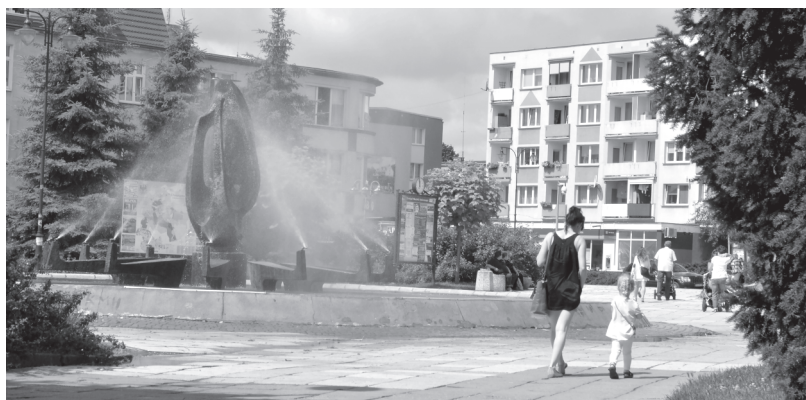
fol. Tadeusz Krawiec

To, co obecnie tam widzimy, powstało na gruzach starego miasta, które w prawie 90 procentach zniszczone zostało w trakcie działań wojennych, prowadzonych w lutym 1945 roku. Wcześniej, na