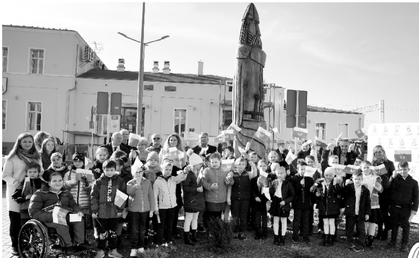
Chwilę po odsłonięciu Choszcza II do pamiątkowej fotografii stanęli m.in. uczniowie szkoły podstawowej nr 1 i nr 3