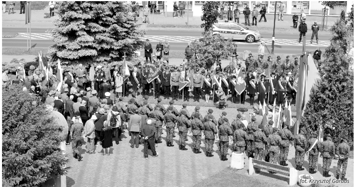
Podobnie jak w 2012 roku, także i teraz główne uroczystości odbędą się przy pomniku „Pamięci Jeńców Oflagu IIB”.

W obozie zorganizowano Wyższe Kursy Nauczycielskie, Koło Inżynierów i Techników, Studium Politechniczne z wydziałami: