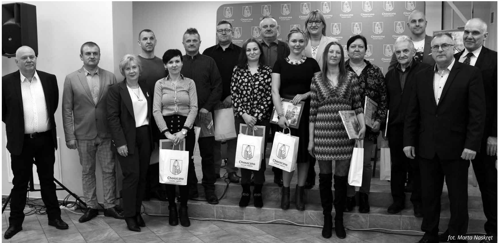
Pamiątkowe zdjęcie z uczestnikami spotkania z okazji Dnia Sołtysa.