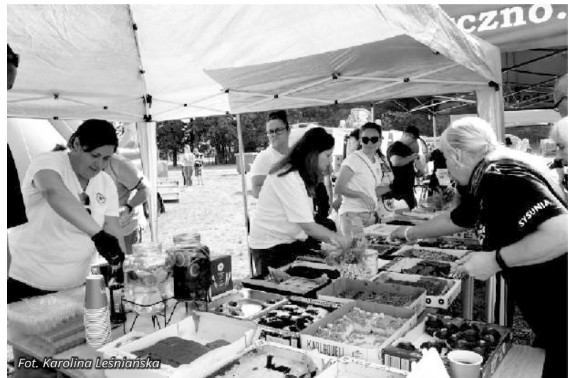
Jak widać na zdjęciu, na „Festynie strażackim dla Olusia” powodzeniem cieszyły się wypieki pań z KGW w Oraczewicach, no i choszczeńska kranówka.